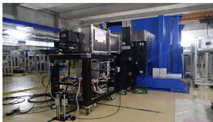
理化学研究所(和光市)に建設中の 小型中性子源小角散乱装置 ( ib-SANS )

加速器で発生した中性子は、電子の雲を突き抜けて原子核の近くで核力で散乱します。核力で散乱することは、同位体に優れた感度を持つことを意味します。本研究室では中性子小角散乱のビームラインを手作りで建設して、固体高分子型燃料電池、リチウムイオン電池、生体膜、タイヤなどのゴム材料などのソフトマターの研究を行っています。